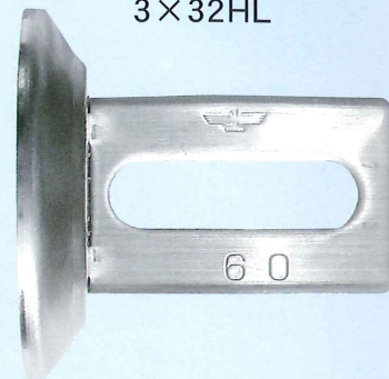
くるピタ君専用アンカー